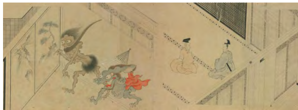
『百鬼夜行絵巻』[江戸中期] 写