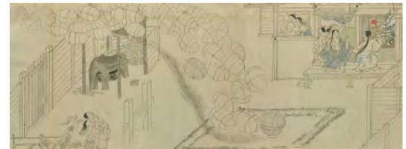
『志貴山縁起』[江戸中期] 写

その他の展示資料（一部） 『源氏物語絵詞』和田正尚 模写 明治44(1911)、『伴大納言繪巻』書写年不明、『平治物語繪巻』住吉内記[ほか写][寛政頃]、『浦島太郎』[室町末期-江戸初期] 写、『春日権現験記』板橋貫雄 [写]、『付喪神繪』[江戸時代] 写、『伊吹とうし』[江戸前期] 写