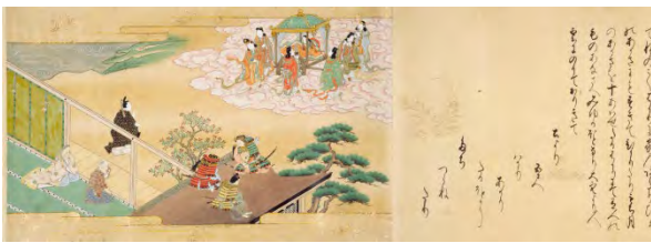
『竹とり物語』[江戸前期] 写