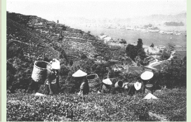
表面画像及び画像①は「国立国会図書館デジタルコレクション」ではモノクロ画像