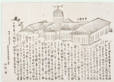
▲大日本国会仮議事堂図 明治22(1889)年4月【憲政資料室収集文書 1301】