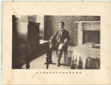
◀「貴族院書記官長時代の柳田国男」 『帝国貴族両院写真画帖』 東京タイプ社 大正6(1917)年

展示資料は、国立国会図書館憲政資料室で所蔵する、政治 家や軍人などが遺した書簡、日記、各種書類を主体として、 その他の当館の蔵書(図書や雑誌、貴重な錦絵など)、当館 以外の機関から出陳していただいた図面、写真、模型など、 バラエティに富んだものです。これらを用いて、議会政治 や議事堂の歴史を様々な形で表すことを試みました。