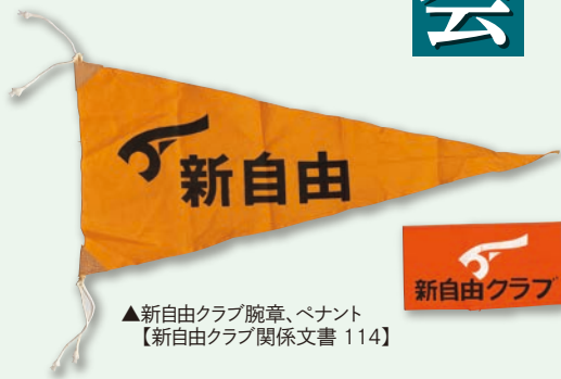
▲新自由クラブ腕章、ペナント 【新自由クラブ関係文書 114】