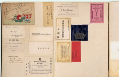
▲ピゴットアルバム 【憲政資料室収集文書 1251】