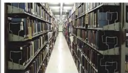
東京本館 本館書庫