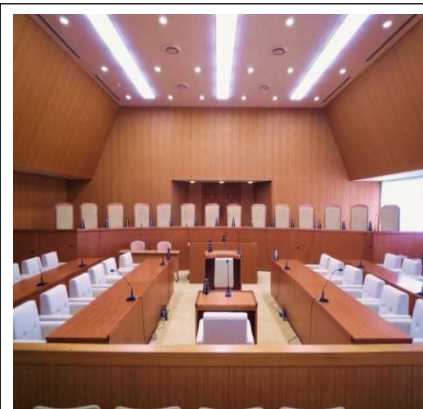
裁判官弾劾裁判所法廷