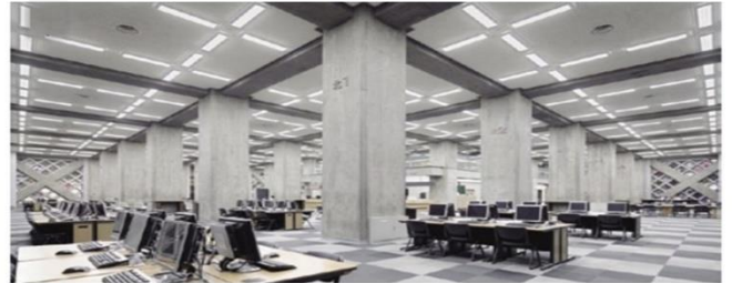
東京本館 本館目録ホール