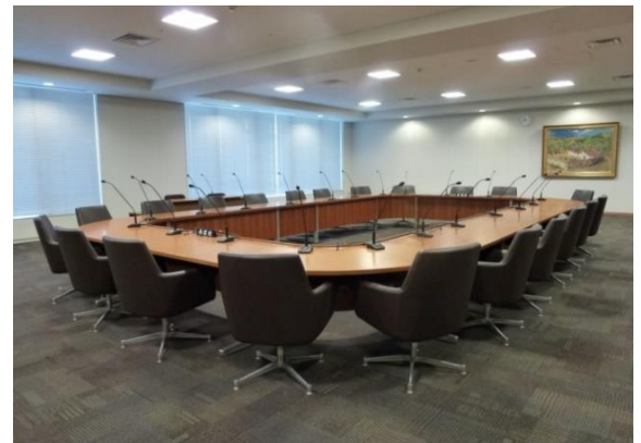
裁判官訴追委員会会議室

1日当たりコスト: 34.3万円(34.7万円) (参考)単位:年間日数 365日(365日)