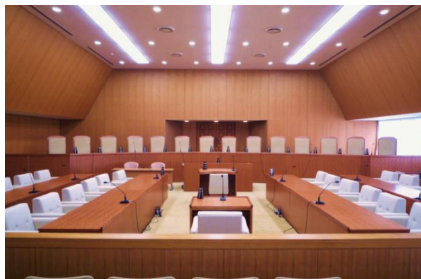
裁判官弾劾裁判所法廷